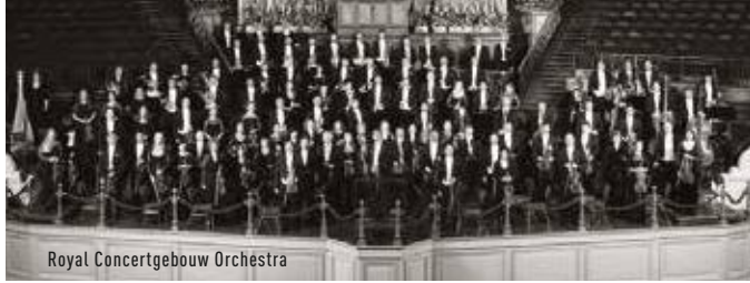
Royal Concertgebouw Orchestra