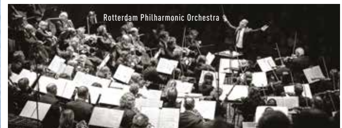
Rotterdam Philharmonic Orchestra