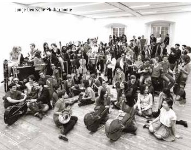
Junge Deutsche Philharmonie