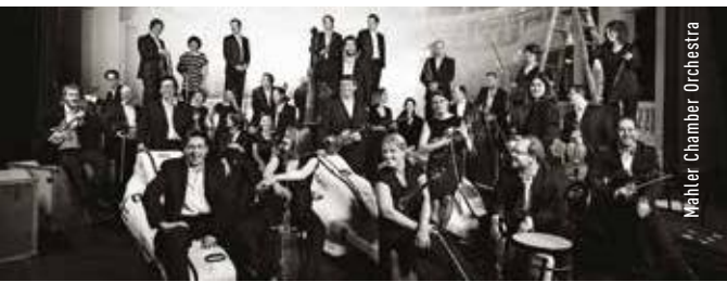
Mehler Chamber Orchestra