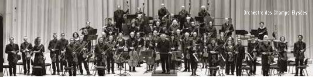
Orchestre des Champs-Élysées