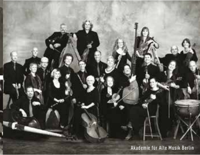
Akademie für Alte Musik Berlin