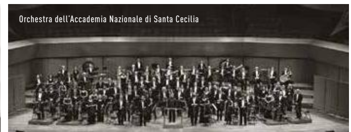
Orchestra dell'Accademia Nazionale di Santa Cecilia